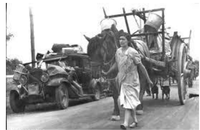
La Débâcle de 1940, Français fuyant le Nord du pays.

Les Français paniquent et fuient le Nord du pays.