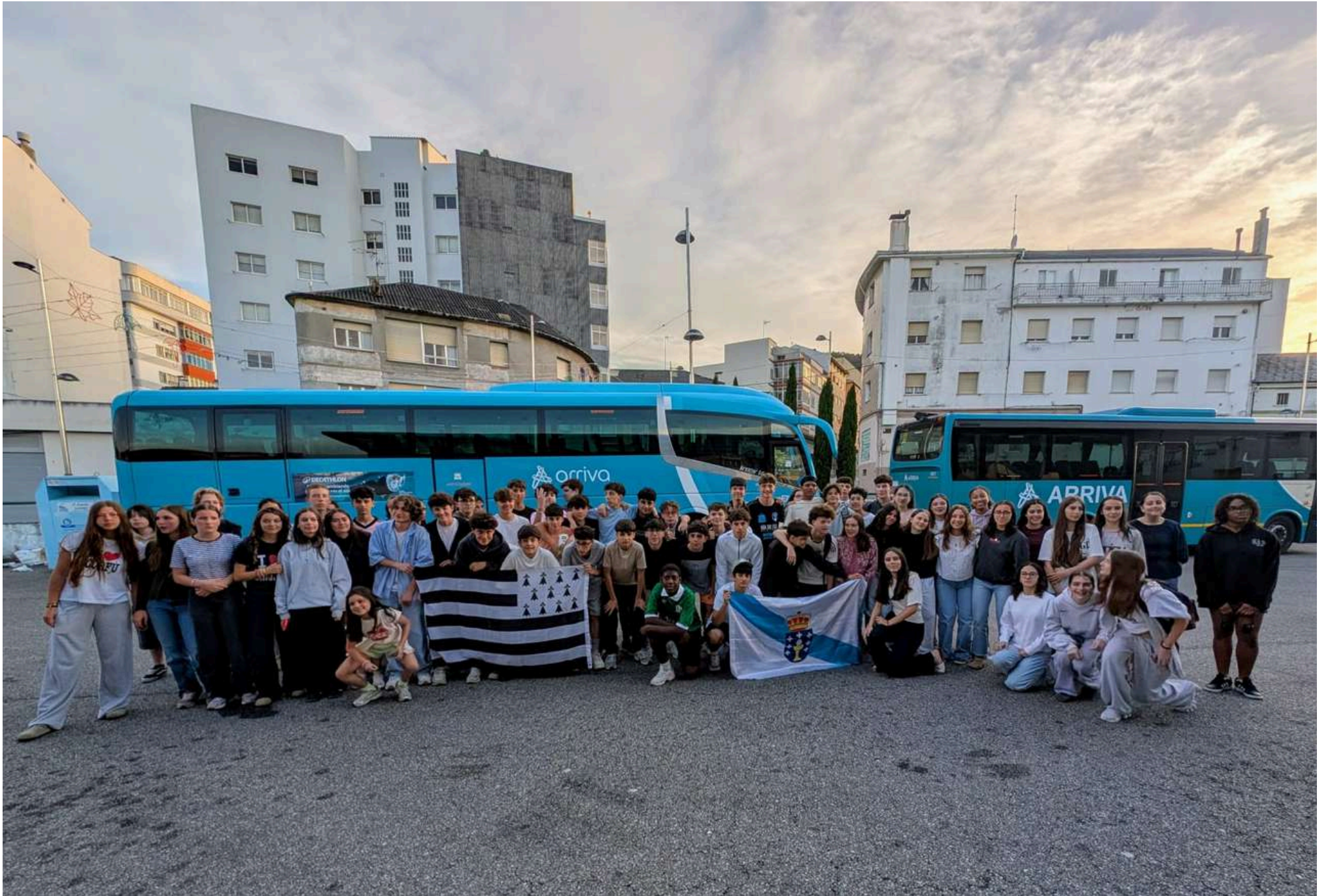
Les élèves du collège Le Landry de Rennes avec leurs correspondants galiciens à la gare routière de Burela au moment de départ le dimanche 24 mai