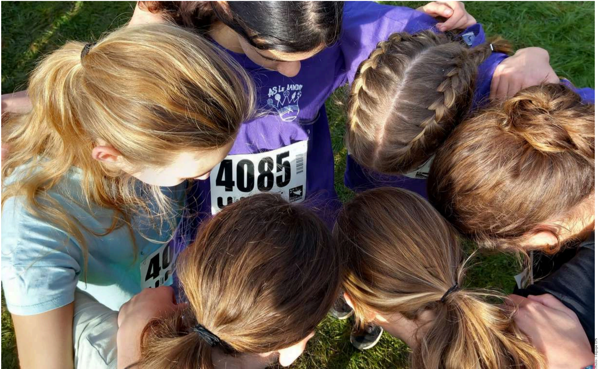
Une de nos équipes en pleine concentration au cross départemental, bravo à l'équipe qui s'est qualifiée pour le cross académique !