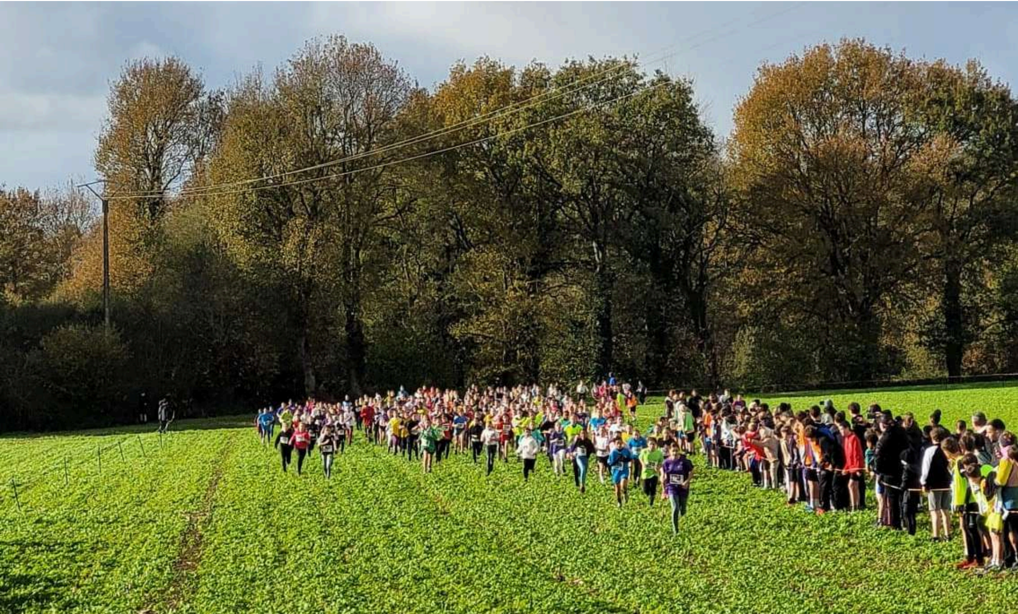
Le cross départemental a eu lieu à La Mézières le 19 novembre, 51 élèves du collège ont participé et 12 se sont qualifiés pour le cross régional