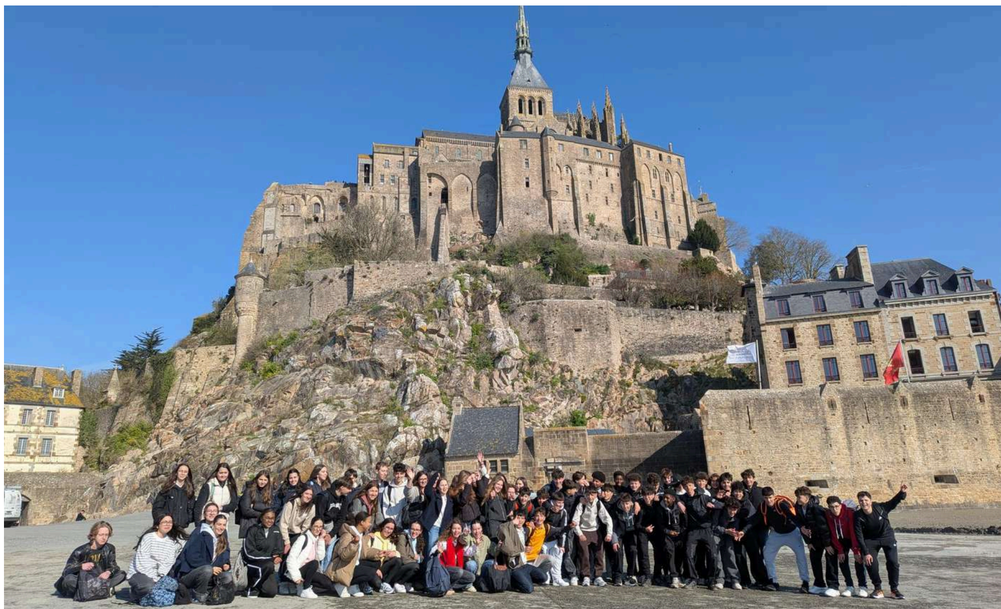
Les élèves de 3ème avec leurs correspondants espagnols, venus une semaine en Bretagne, se sont retrouvés pour une visite du Mont Saint-Michel le 19 mars dernier