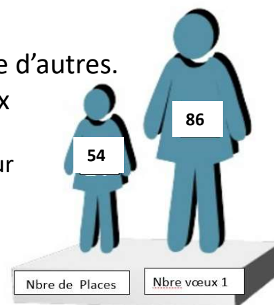
Famille des métiers de la relation client Bac pro «Métiers du commerce et de la Vente»

En tenir compte lors du classement des vœux (ne pas hésiter à vous rapprocher de la Psychologue de l'éducation nationale, du professeur principal ou du secrétariat afin de connaître le taux de sélectivité des formations)